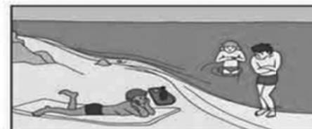
Не переохлаждайтесь и не перегревайтесь. Не купайтесь, если температура воды ниже 18°.