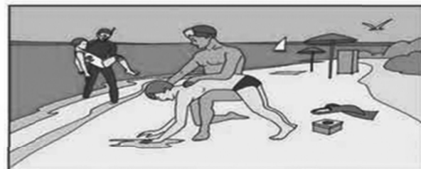
Доставив пострадавшего на берег, очистите ему полость рта и удалите воду из дыхательных путей, легких и желудка!

В любой ситуации на воде главное не паниковать!