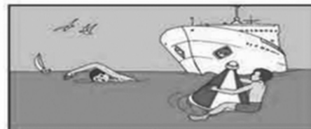
Не подплывайте к проходящим судам и не забирайтесь на предупредительные знаки.