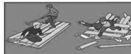
Не используйте для плавания самодельные устройства! Они могут перевернуться.