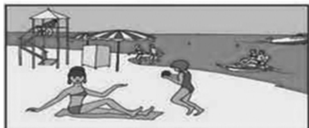
Купайтесь только в разрешенных местах, на благоустроенных пляжах.