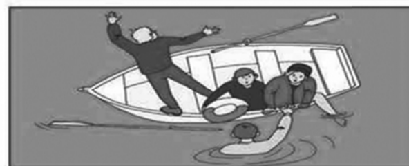
Поднимайте упавшего их воды только с кормовой части тонущего средства!