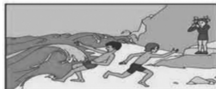
Не купайтесь в штормовую погоду! Берегитесь волны.