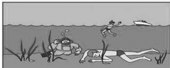
Не оставляйте попыток достать утопающего со дна.