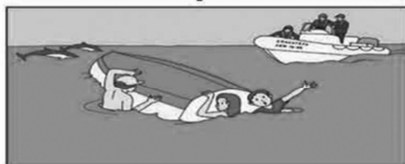
Не отплывайте от перевернувшейся лодки до прибытия подмоги!