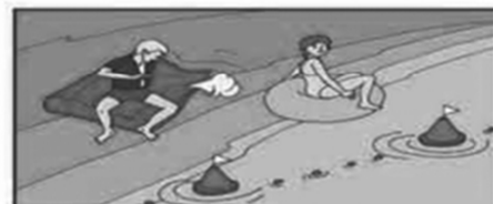
Не заплывайте далеко от берега на надувных матрасах и автомобильных камерах.