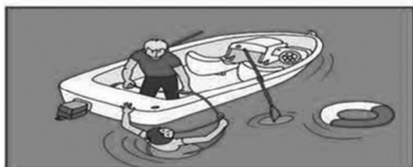
Используйте для спасения любые подручные средства!