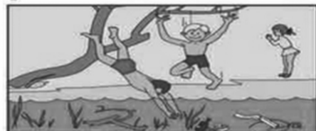
Не прыгайте в незнакомых местах! Не известно, что может оказаться на дне!