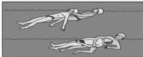
Не давайте утопающему схватить вас. Следите за тем, чтобы его голова постоянно находилась над водой!